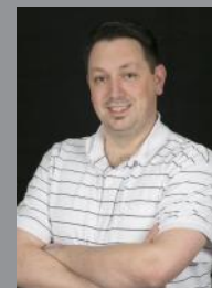
Davide Bruno als Regisseur